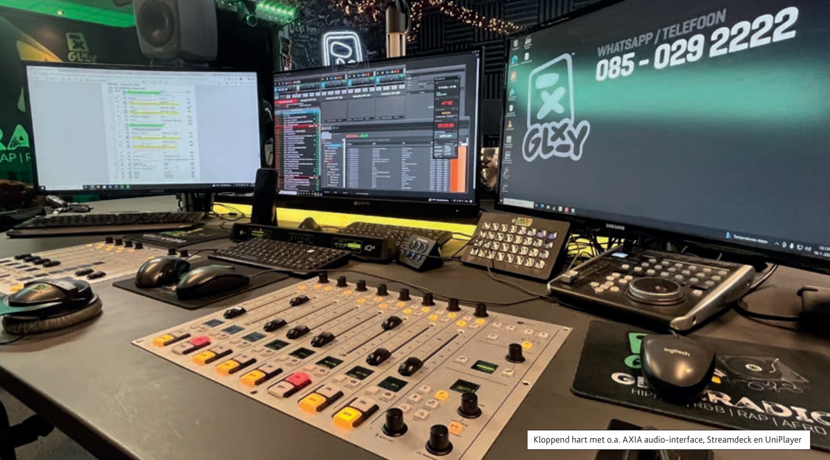
Kloppend hart met o.a. AXIA audio-interface, Streamdeck en UniPlayer